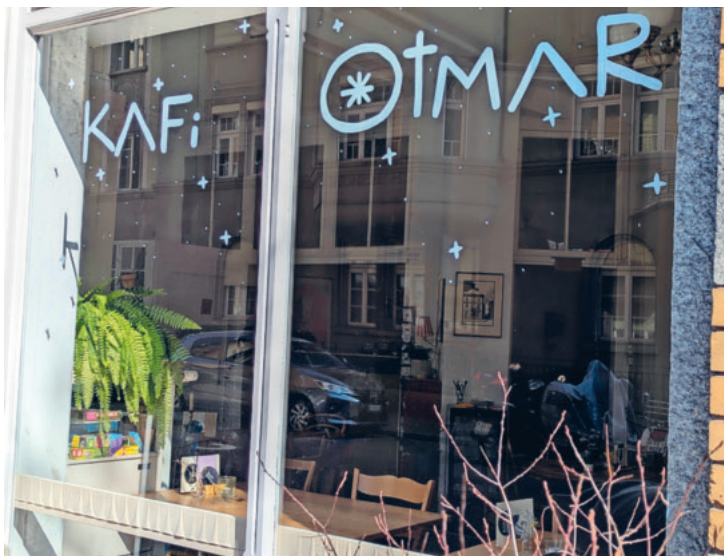
Text und Bilder: Uwe Habenicht

Manchmal gelingt es einfach nicht, mit anderen ins Gespräch zu kommen. Das Gespräch nimmt entweder schon nach den ersten Sätzen eine konfrontative Wendung oder bleibt im Banalen hängen. Diese Erfahrung machen wir täglich und spüren dabei immer wieder den Wunsch, erfüllende und gute Begegnungen zu haben. Gute Kommunikation besteht aber nicht aus cleveren Tricks, sondern entsteht aus einer bestimmten Haltung heraus, die ich im Kontakt mit anderen einnehme.